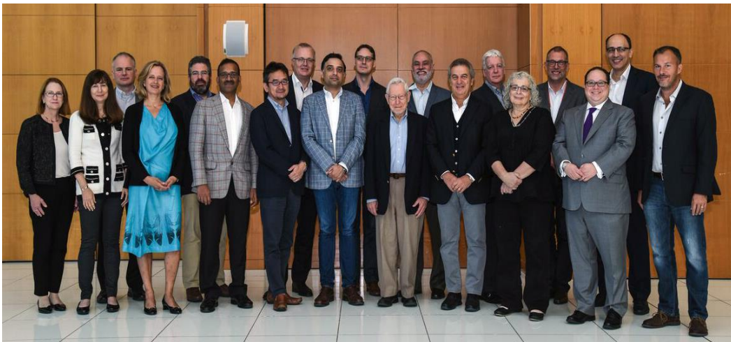
ICANN 60 次會議正式宣佈董事會新任領導團隊

因 ICANN 成立了根區評估審查委員會(Root Zone Evaluation Review Committee)，對建議之網路架構與網路運作之改變時提供審議及提出意見，或是對前述之改變向 ICANN 董事會提出建議。另外該委員會也將會對相關之議題進行考量以鑑別任何與網路架構與網路運作潛在之安全、穩定或可立即恢復性。ccNSO 也針對根區評估審查委員會之成立進行報告。