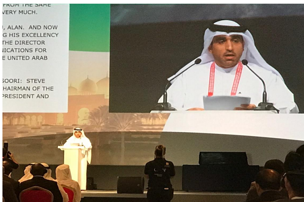
阿拉伯聯合大公國電信監管局 (TRA) 局長 H.E. Hamad Obaid Al Mansoori 開幕專講

ICANN 60 由阿拉伯聯合大公國 (UAE) 電信監管局 (TRA) 主辦。本屆會議彙聚來自全球政府諮詢代表、商業界、公民社會、非政府組織、研究機構、技術社群和其他全球利益相關利益方。此次會議促成廣泛的網際網路相關議題的討論，並向與會人員報告多重利益相關方所關注的最新議題。